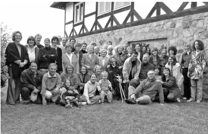
Versammlung, Waldhof, Bad Eilsen

Der Festakt wird in feierlichem Rahmen gestaltet.