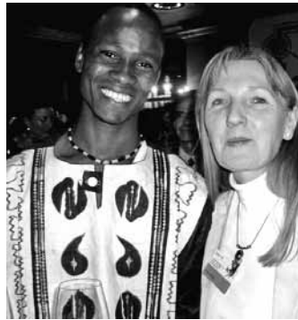
Bei der Unterzeichnung

Unter dem Motto: „Collaboration in consciousness“ (Zusammenarbeit im Bewusstsein) trafen sich etwa 150 Teilnehmer verschiedener Organisationen aus allen Teilen der Welt, um die mögliche Gründung eines Weltparlamentes der Spiritualität zu erarbeiten. Die Teilnehmer repräsentierten Vi-