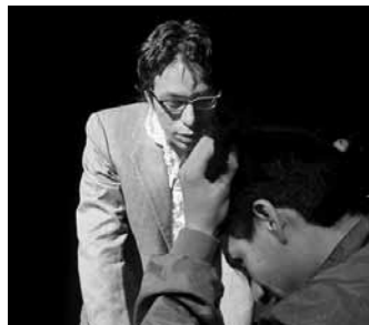
Mit Engagement dabei: Kurze Szenenmomente aus der Aufführung

...denn so hieß schließlich das Theaterstück, das nach einer langen Reise von fast vier Monaten – von Anfang Februar 2005 bis Ende Mai 2005 – auf die Bühne kam. Verbunden durch Bewegungs- und Tanzszenen, entspannt sich über eineinhalb Stunden ein Szenenbogen, der Teile der berühmten Vorlage, improvisierte Szenen aus der Erfahrungswelt der jungen Schauspieler zum selben Thema und ihre Erzählungen sowie Kommentare zu „Liebe“ und „Gewalt“ umschloss. All das war getragen von den Gedanken, Erfahrungen, und Gefühlen, die die fünf Darsteller in der Workshopzeit erfahren und durchlebt hatten, von den Erkenntnissen, die aus den intensiven Begegnungen mit sich und der Geschichte Shakespeares resultierten, und schließlich von dem darstellerischen Können, das sie sich in diesen Monaten aneignen konnten. Es war mir wichtig den Bedürfnissen nach Selbsterfahrung und Selbstausdruck, die umso stärker wurden, je tiefer wir gingen, nachzugeben. In dem Theatersaal, saßen, dicht gedrängt, an jedem Abend zwi-