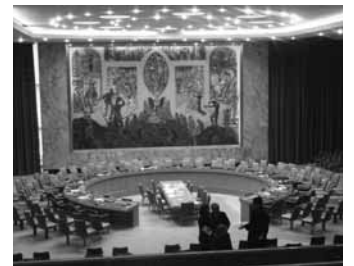
Plenary Sitzung UN/DPI Conference (NY)

Eine einfache Abänderung der UN-Charter könnte wie folgt lauten: Der Generalsekretär und der Präsident der Generalversammlung sollten ipso facto zu Mitgliedern des Sicherheitsrates mit Vetorecht werden. Zweifellos sind die Länder, die sich um Verantwortung und eine permanente Mitgliedschaft im UN Sicherheitsrat bemühen auch fähig, diese ehrenvolle Aufgabe zu erfüllen. Um dem zunehmenden Bedürfnis nach kollektiver Sicherheit und der Sorge der Staatengemeinschaft nach Erhaltung des Friedens zu begegnen, bedarf es großer Entschlossenheit bei den Reformen zur Stärkung der UN Strukturen und seiner Organe. Solche Reformen sollten finanzierbar und durchführbar sein. Letztendlich wurden der Generalsekretär und der Präsident der Generalversammlung ordnungsgemäß von den Mitgliedsregierungen gewählt und eine erweiterte Aufgabe würde eine neue und zuversichtliche Globale Balance bringen.