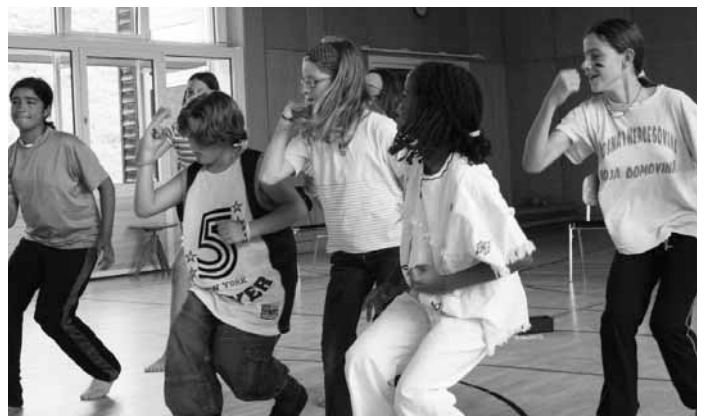
Theater und Tanz

For these children, the Children's Camp is yet another piece of the puzzle of a successful integration into Switzerland that links their time spent between school and their residence home.