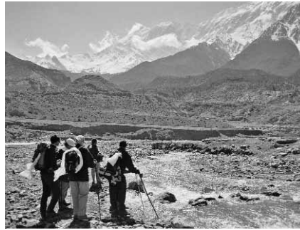
Der Blick auf's Himalaya